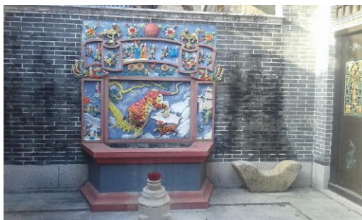
Hình 2. Bàn thờ hổ trong tư gia của người Hoa [3].

Ở Trung Quốc, tục thờ “hổ” cũng là một hiện tượng văn hóa vô cùng quan trọng. Trong tín ngưỡng thờ cúng của người Trung Quốc, cũng có rất nhiều động vật có thật, nhưng trong đó, tục thờ “hổ” quan trọng nhất. Trong