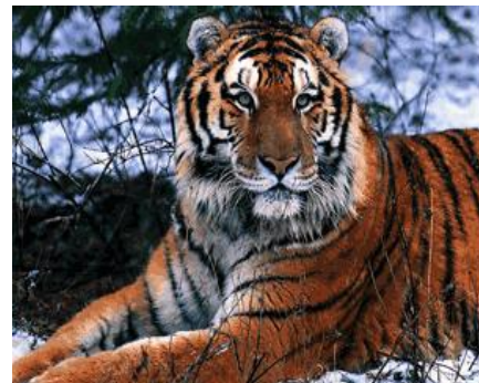
Hình 1. Màu lông trên trán hổ rất giống với từ “王-Vương” theo tiếng Trung Quốc do đó người dân nước này tin rằng con hổ sinh ra vốn đã là vua [5].

Khi nhắc đến hổ của Trung Quốc, không thể không nhắc đến việc hổ là biểu tượng của các bậc đế vương. Người Trung Quốc họ quan niệm rằng, những vết sọc trên trán của hổ liên tưởng đến chữ 王 (vương), theo tiếng Trung có nghĩa là vua. “Hổ” được coi là vị vua của muôn thú, là chúa sơn lâm, nên các vị vua Trung Quốc so sánh mình với hổ, hy vọng bản thân mình có thể bản lĩnh như hổ và có thể cai trị lãnh thổ của mình như hổ cai trị rừng. Cho nên chữ “王” vua cũng bắt nguồn từ đây. Người Trung Quốc coi hổ là chúa sơn lâm. Do đó, cũng có ít câu thành ngữ có từ “hổ” có thể phản ánh được nội dung này, ví dụ: “一山不藏二虎” câu thành ngữ này có nghĩa là một núi không thể có 2 hổ, cũng như một nước không thể có 2 vua [4].