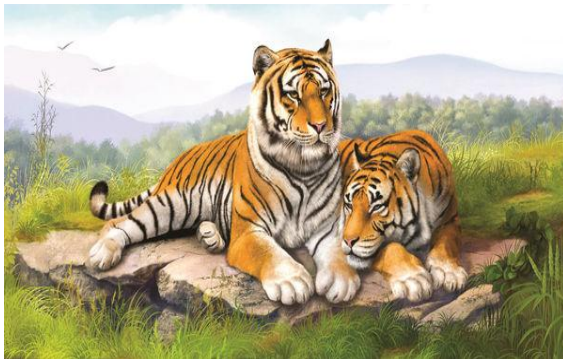
Hình 6. Trong tín ngưỡng dân gian của người Việt, hổ là loài vật linh thiêng, được tôn thờ, sùng bái [12].

Ở Việt Nam, “hổ” còn tượng trưng cho sức mạnh. “Hổ” là chúa sơn lâm, là chúa tể của rừng núi, vua của muôn loài... “hổ” là dã thú có sức mạnh, là động vật tinh khôn, to khỏe và nhanh nhẹn, hung dữ, dám đối địch nhiều thú to khỏe khác cùng với tiếng gầm rống rung chuyển núi rừng gây khiếp đảm cho muôn loài, Việt Nam có rất nhiều câu thành ngữ lấy hình ảnh của “hổ” để mô tả, ví dụ: “勇猛如虎” mạnh như hổ, thành ngữ này không chỉ von vắn ba chữ “mạnh như hổ”, mà câu thành ngữ đã ví von để nhấn mạnh sức mạnh của loài “hổ”, có sức mạnh to lớn, không một ai chống lại được. Khi nói đến sức mạnh và lòng dũng cảm, điều đầu tiên người Việt Nam sẽ nghĩ đến ngay hình ảnh của “hổ”. “Long tranh hổ đấu” (龙争虎斗), “lưỡng hổ tương tranh” (两虎相争), qua 2 câu thành ngữ này chúng ta có thể thấy rằng, ở một góc độ nào đó, suy nghĩ của người Việt Nam và người Trung Quốc có chút tương đồng. Cả 2 nước đều lấy hình ảnh của “rồng” và “hổ” cùng ghép lại với nhau để tạo nên một câu thành ngữ. Thông thường, những thành ngữ có “rồng” và “hổ” hầu hết đều mang ý nghĩa ca ngợi. Trong tình huống này cũng tương tự, 2 câu thành ngữ đều nói lên sức mạnh, quyền uy của “rồng” và “hổ”.