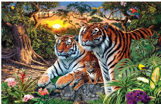
Hình 2. Hổ không chỉ là biểu tượng của sức mạnh mà còn mang quyền uy chi phối hung dữ của kẻ anh hùng [6].

Bên cạnh đó, “hổ” còn tượng trưng cho lòng dũng cảm và kiên cường của người lính. Ở Trung Quốc cổ đại, dấu hiệu để điều binh hời xưa được gọi là “虎符” - hổ phù, là tín vật của các vị vua cổ đại ban quyền lực quân sự trao cho tướng lĩnh mệnh đi tham chiến, nếu không có hổ phù thì thống soái không có quyền điều binh khiển tướng. “Hổ” là chúa sơn lâm, nói đến rừng là nghĩ ngay tới vị vua - “hổ”. Trong chiến tranh, “hổ” tượng trưng cho sức mạnh uy quyền của vị tướng quân dũng mãnh, can trường, rất được các binh lính tôn kính. Trong tiếng Hán có tương đối nhiều câu thành ngữ như vậy, ví dụ: “虎视眈眈” hổ thị đăm đăm - nhìn chăm chăm như hổ đói, “如狼似虎” như lang tựa hổ (hung dữ như hổ và sói, hung bạo và tàn nhẫn), “调虎离山” điệu hổ ly sơn (lừa cho hổ ra khỏi núi, dụ ý rù người khác ra khỏi vị trí ẩn nấp thuận lợi để dễ bề tấn công), “虎口余生” thoát khỏi miệng hùm (thoát khỏi những tai hại), “不入虎穴焉得虎子” không vào hang hùm sao bắt được cọp con (chỉ người phải có gan mạo hiểm mới làm được việc khó), “龙精虎猛” long tinh hổ mãnh (chỉ tinh lực dồi dào và ý chí chiến đấu sôi sục), “龙骧虎步” long tương hổ bộ (chỉ khí phách hùng tráng và quyền thế)... Thành ngữ “龙精虎猛” long tinh hổ mãnh (mô tả lên tinh lực dồi dào và ý chí chiến đấu sục sôi).