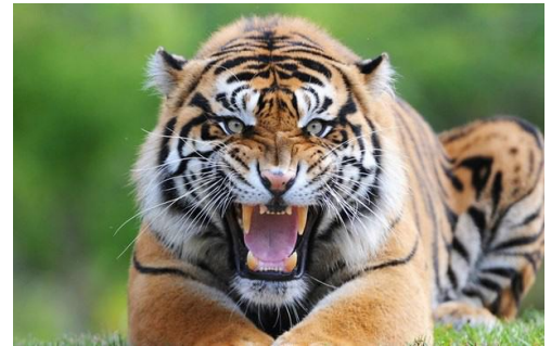
Hình 5. Hổ là vị Chúa sơn lâm, ngự trị và cai quản cả núi rừng [11].

Biểu tượng “hổ” của Việt Nam cũng giống với Trung Quốc, “hổ” cũng tượng trưng cho hình ảnh của vua, biểu tượng của quyền uy và sức mạnh. Người Trung Quốc họ ví “hổ” với vua vì những vết sọc trên trán của hổ có chữ “王” vương, người Việt cũng dùng hình ảnh “hổ” để tượng trưng cho vua, nhưng không phải vì chữ “王” trên trán của “hổ”, là bởi vì “hổ” dũng mãnh và uy lực. Nhắc đến “hổ”, mọi người sẽ liên tưởng ngay tới một hình ảnh bất khuất và kiên cường. “Hổ” gầm khiến ai ai cũng phải khiếp sợ, không dám lại gần. “Hổ” là chúa sơn lâm, cho nên bất kỳ động vật nào trong rừng cũng không bao giờ dám đọ sức với “hổ”. Sự oai phong của hổ trong rừng cũng giống như quyền uy của mỗi vị vua trên đất nước của mình. Khi nhà vua ban hành mệnh lệnh, thì bất kể một người dân thường nào cũng không dám chống lại. Trong thành ngữ Việt Nam, có một số câu thành ngữ lấy hình ảnh của vua để miêu tả “hổ”, ví dụ: “跟皇帝交朋友如跟虎开玩笑” làm bạn với vua như đùa với hổ, nghĩa đen của câu thành ngữ này là: vua là một người có quyền uy, là người nắm giữ tất cả các quyền lực tối cao, cho nên có thể kết thân với vua là một điều may mắn, nhưng việc ở bên vua rất dễ gặp nguy hiểm, chỉ cần hơi sơ ý một chút cũng có thể bị mất mạng. Cũng giống như động vật, không một con vật nào dám lại gần và tiếp xúc với “hổ”, bởi vì chúng biết “hổ” sẽ biến chúng thành một bữa ăn bất cứ lúc nào. Nghĩa bóng của câu thành