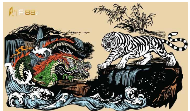
Hình 1. Biểu tượng rồng và bạch hổ [1].

tiếng Trung Quốc ngày càng tăng lên. Một yếu tố quan trọng để có thể học tốt ngoại ngữ đó là nắm vững văn hóa quốc gia sử dụng ngôn ngữ đó.