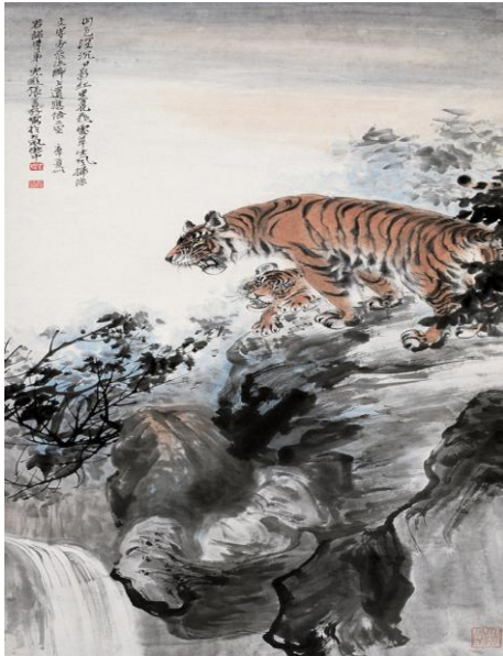
Hình 7. Tranh hổ của Zhang Shanzi [13].

Trước tiên, trong quan niệm của dân tộc hai nước Trung Quốc và Việt Nam, “hổ” của cả hai nước đều tượng trưng cho các bậc đế vương. Cả Trung Quốc và Việt Nam đều coi “hổ” là chúa sơn lâm, vua của muôn loài, hùng dũng vô song, hung dữ khác thường, ai ai cũng sợ hổ. Từ chỗ vừa sợ hãi vừa kính phục dẫn đến sùng bái “hổ”. Hình tượng của “hổ” có ảnh hưởng sâu sắc đến cuộc sống của người dân trong các phong tục dân gian, tác phẩm văn học cũng như ngôn ngữ thông thường đều xuất hiện bóng dáng của hổ và tiềm ẩn yếu tố văn hóa “hổ”. Trong thành ngữ của Trung Quốc “một núi không thể có hai hổ” (一山不容两虎) nghĩa là một nước không thể có hai vua. Trong thành ngữ của Việt Nam “làm bạn với vua như đùa với hổ” (跟皇帝交朋友如跟虎开玩笑), người ta dùng trực tiếp hình ảnh của vua để so sánh với “hổ”, điều này biểu thị “hổ” tượng trưng cho hình ảnh của vua.