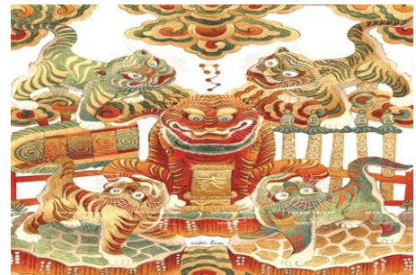
Hình 8. Ngụ hổ, tín ngưỡng thờ Mẫu trong tranh Hàng Trống [14].

Thành ngữ có chứa từ “hổ” của Việt Nam và Trung Quốc còn tượng trưng cho những tình huống nguy hiểm, bởi vì “hổ” có dáng vẻ hung dữ và táo tợn, có những vũ khí sắc nhọn trên cơ thể như: móng vuốt, đuôi, miệng... điều đó khiến cho con người có cảm giác sợ hãi. “Hổ” có bản tính hung bạo, nên tất nhiên con người và các loài muôn thú chỉ có thể dám nhìn hổ từ xa, nếu như tiếp xúc gần với “hổ” sẽ dễ gây ra những hậu quả khó lường. Trung Quốc có thành ngữ: “羊落虎口” (dê rơi vào miệng cọp), “虎口逃生” (thoát khỏi miệng cọp)... những câu thành ngữ này đều chỉ kẻ yếu rơi vào tay những kẻ xấu xa. “Hổ” thường khiến cho con người có cảm giác sợ hãi, vì thế con người thường không lại gần “hổ”. Đối với con người, gần “hổ” là một điều gì đó rất đáng sợ. Thành ngữ Trung Quốc cũng có nhiều câu đề nói về vấn đề này, ví dụ: “骑虎难下” (thể cưỡi trên lưng cọp), “虎口拔牙” (nhổ răng cọp, vuốt râu hùm). Thành ngữ Việt Nam cũng có rất nhiều, ví dụ: “ngồi trên lưng cọp” (坐在老虎背上), “vuốt râu hùm” (虎口拔牙). Có thể thấy rằng ý nghĩa của hai câu thành ngữ “虎口拔牙” và “vuốt râu hùm” đều giống nhau.