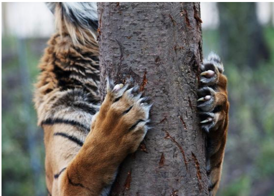
Hình 4. Vủ khí của hổ là bộ móng vuốt sắc nhọn [10].

Thành ngữ có chứa từ “hổ” còn tượng trưng cho những tình huống và hoàn cảnh nguy hiểm. Ý nghĩa này xuất phát từ những bộ phận tấn công đối phương cực kỳ ghê gớm và nguy hiểm trên cơ thể của “hổ”, chẳng hạn như móng vuốt, miệng, đuôi,... Ngoài ra, nó còn xuất phát từ ảnh hưởng của việc loài hổ tấn công và làm hại con người, do đó đã tạo ra một cảm giác sợ hãi cho con người. Thứ hai, “hổ” luôn khiến cho người khác có cảm giác “hổ” sẽ tấn công và ăn thịt mình. “Hổ” rất hung hãn và dữ dằn, mọi người thường không tiếp xúc hoặc lại gần với “hổ” để tránh gặp phải những điều đáng tiếc sẽ xảy ra. Đối với con người, tiếp xúc với “hổ” là một điều gì đó rất đáng sợ. Trung Quốc cũng có rất nhiều câu thành ngữ nói về ý nghĩa này, ví dụ: “握蛇骑虎” ác xà kị hổ (cầm rắn cưỡi hổ, ví hoàn cảnh nguy hiểm), “骑虎难下” đâm lao phải theo lao (chỉ việc đã làm